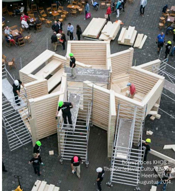
Bouwproces KHOR III! Theaterfestival Cultura Nova Heerlen (NL), Augustus 2014.