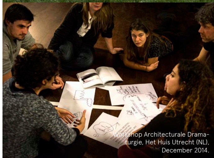
Workshop Architecturale Dramaturgie, Het Huis Utrecht (NL), December 2014.