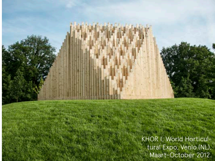
KHOR I, World Horticultural Expo, Venlo (NL), Maart-October 2012.

In het tweede deel van het project ontwerp je met dit bouwpakket een paviljoen. De tweede randvoorwaarde voor dit paviljoen is dat het door de bezoekers van Bokrijk zelf, binnen een dag kan worden opgebouwd.