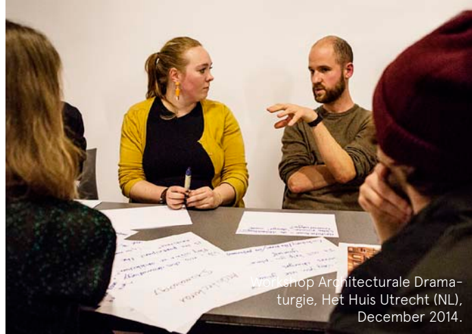
Workshop Architecturale Dramaturgie, Het Huis Utrecht (NL), December 2014.