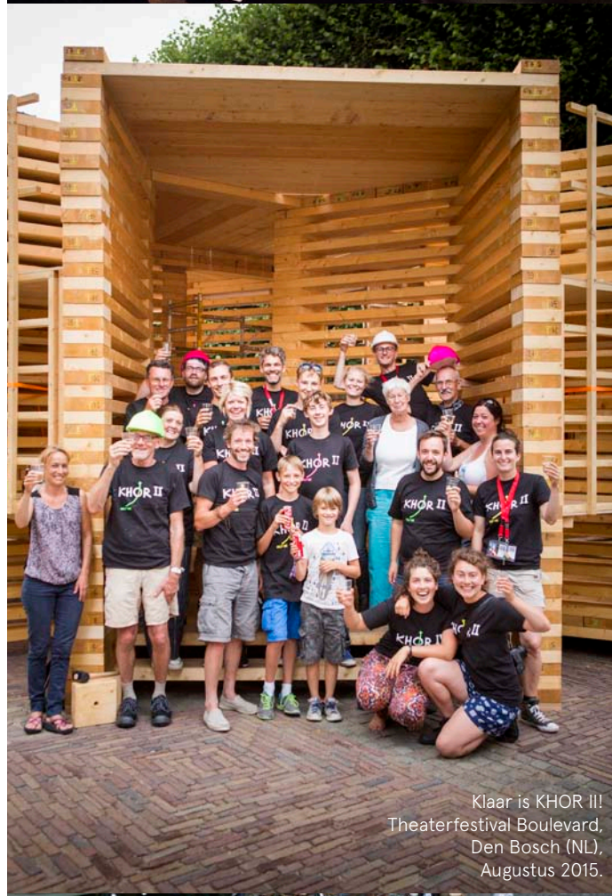
Klaar is KHOR III! Theaterfestival Boulevard, Den Bosch (NL), Augustus 2015.