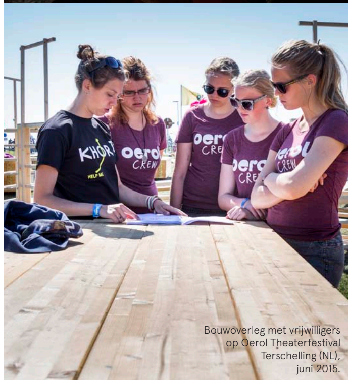
Bouwoverleg met vrijwilligers op Oerol Theaterfestival Terschelling (NL), juni 2015.