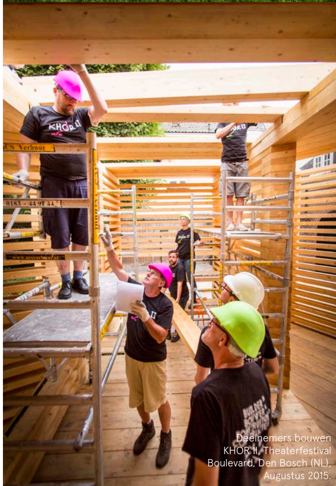
Deelnemers bouwen KHOR II, Theaterfestival Boulevard, Den Bosch (NL), Augustus 2015.