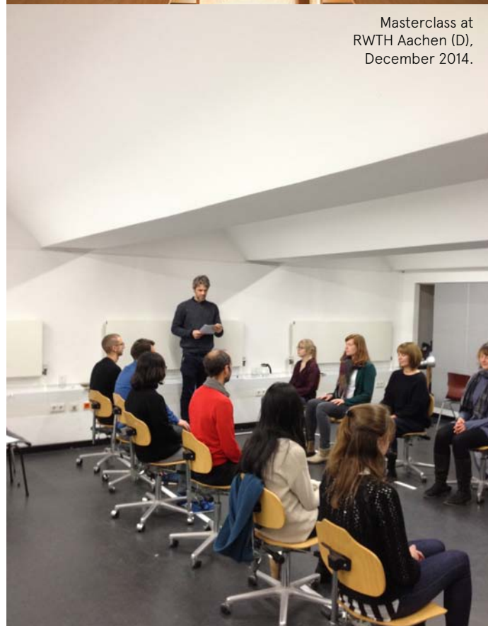
Masterclass at RWTH Aachen (D), December 2014.