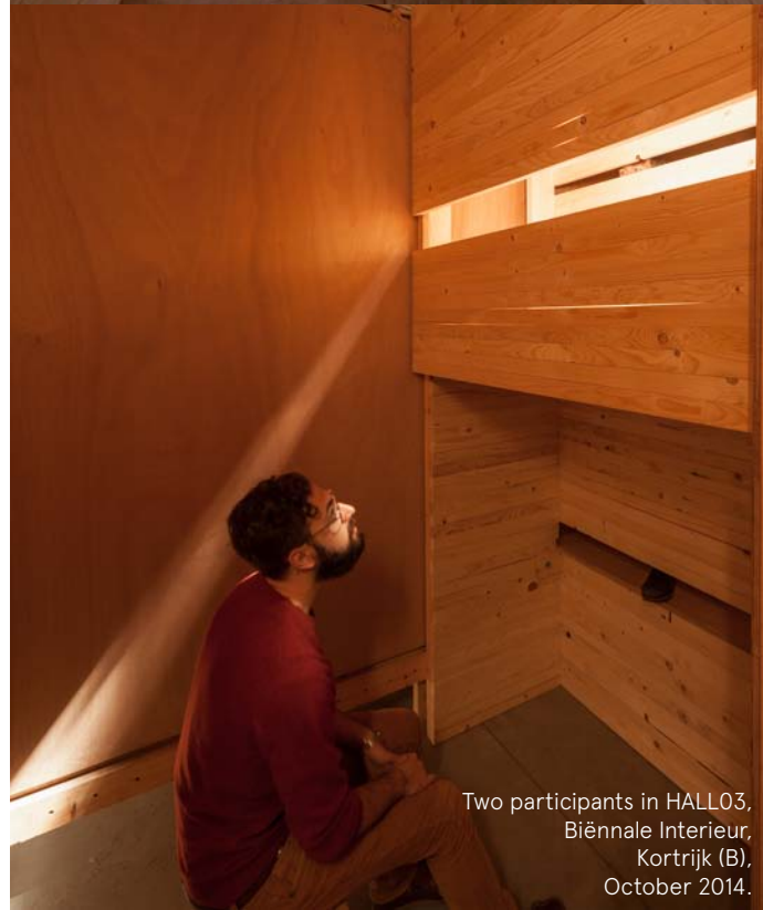
Two participants in HALL03, Biennale Interieur, Kortrijk (B), October 2014.