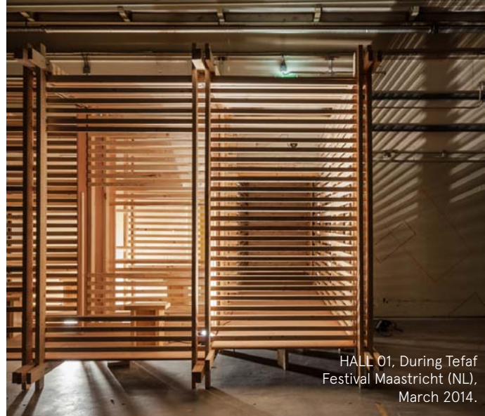
HALL 01, During Tefaf Festival Maastricht (NL), March 2014.

Het HALL2016/17 programma verbindt als zodanig gespecialiseerd artistiek onderzoek met een breed en divers Europees publiek.