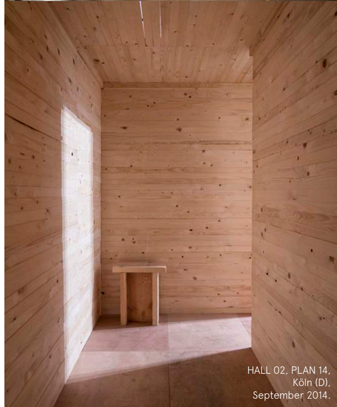
HALL 02, PLAN 14, Köln (D), September 2014.