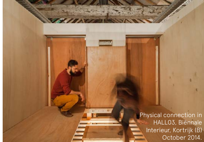
Physical connection in HALLO3, Biënnale Interieur, Kortrijk (B) October 2014.