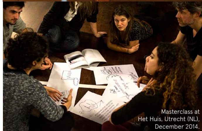
Masterclass at Het Huis, Utrecht (NL), December 2014.