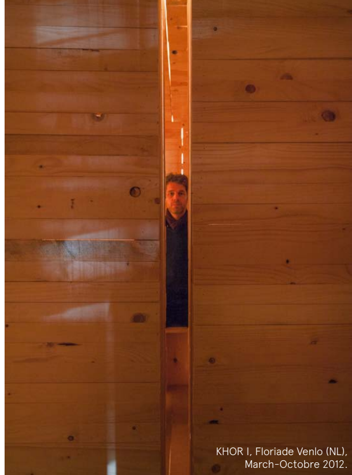
KHOR I, Floriade Venlo (NL), March-October 2012.

Op inhoudelijk niveau draait het HALL2016/17 programma om een cross-cultureel onderzoek naar de (architecturale) dramaturgie van een ontmoeting zonder woorden. Het doel is de zintuiglijke ervaring van deze theatraal opgebouwde ontmoeting te intensiveren en haar gelaagdheid te ontplooiën binnen zowel een urgent maatschappelijke als een cultureel historische context.